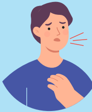
problemas para respirar

Si su médico cree que usted tiene EP, probablemente le haga una prueba para medir la cantidad de un tipo de glóbulos blancos (eosinófilos) en los pulmones.