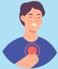
dolor en el pecho